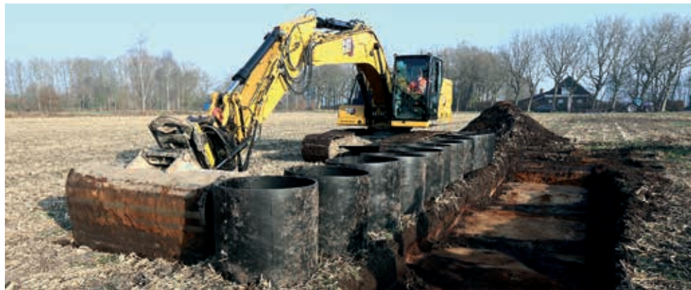
In een weiland bij Makkinga zijn de eerste bodemprofielen gestoken.

Op verschillende plekken in het buitengebied van Ooststellingwerf zijn vorige week de eerste bodemprofielen gestoken voor het Leer- en Kenniscentrum Bodem. Onderzoekers en studenten van het Biosintrum en Van Hall Larenstein gebruiken deze bodemprofielen voor onderzoek naar bodemgezondheid.